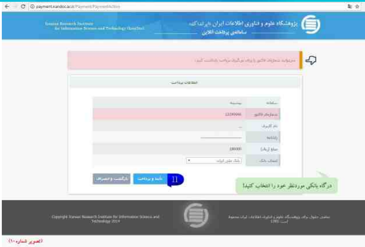
۶. پرداخت را انجام دهید؛