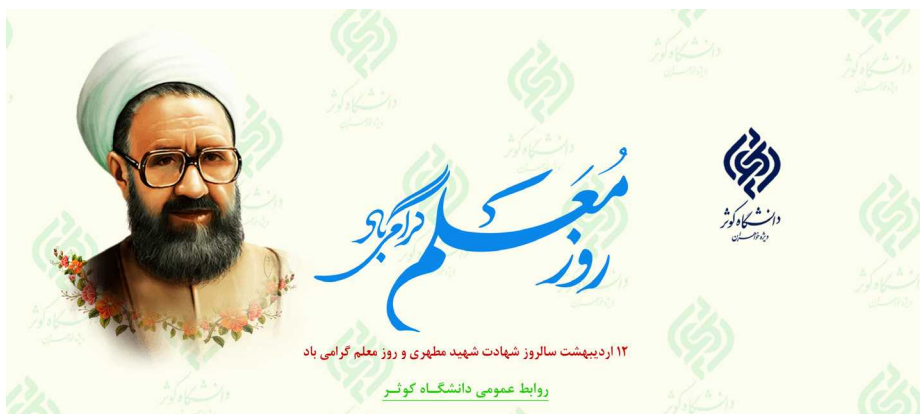
۱۲ اردیبهشت سالروز شهادت شهید مطهری و روز معلم گرامی باد روابط عمومی دانشگاه کوثر