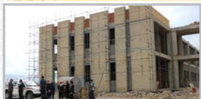
بازدید کارشناسان سازمان مدیریت و برنامه ریزی کشور از پروژه آموزشی ۱۹ مهر