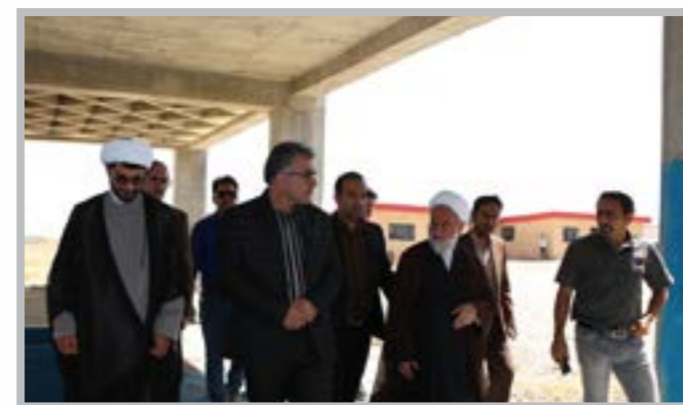
بازدید نماینده ولی فقیه استان از پروژه عمرانی دانشگاه کوثر