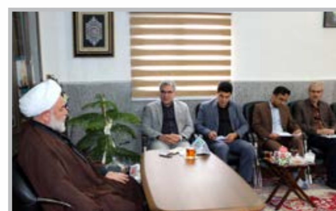
دیدار رییس، معاونان و مدیران دانشگاه کوثر با نماینده ولی فقیه استان به مناسبت هفته دولت