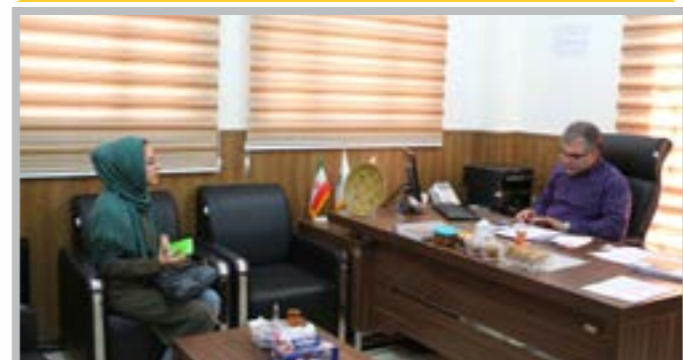
ملاقات عمومی رییس دانشگاه کوثر