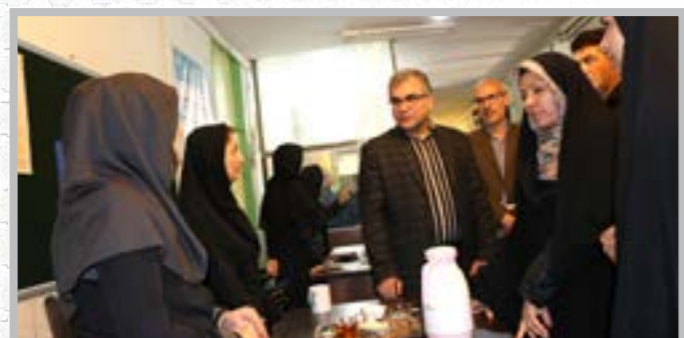
بازدید رییس دانشگاه از روند ثبت نام دانشجویان نو ورود