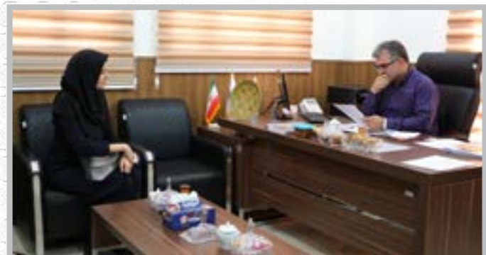
ملاقات عمومی رییس دانشگاه کوثر