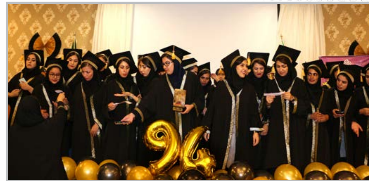
آیین دانش آموختگی دانشجویان دانشگاه کوثر