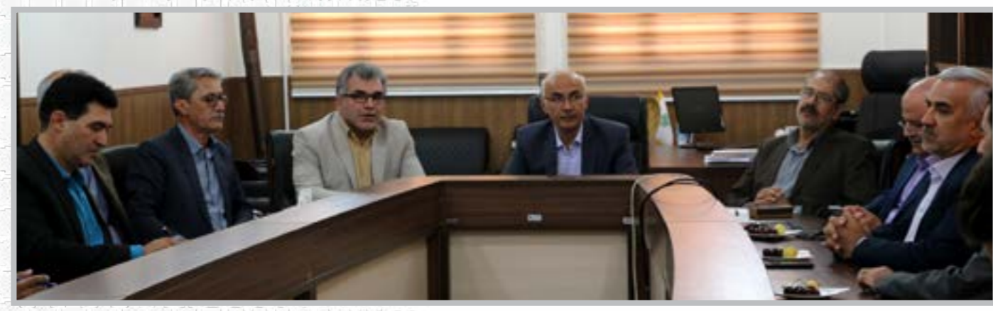
حضور معاون وزیر علوم، تحقیقات و فناوری در دانشگاه کوثر