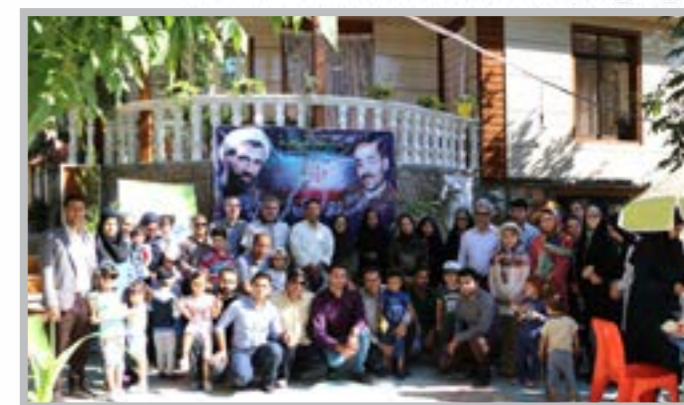
گلگشت فرهنگی- تفریحی به مناسبت روز کارمند