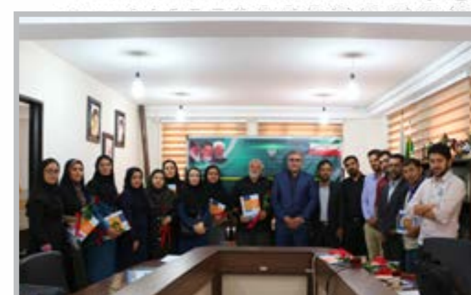
تقدیر از خبرنگاران به مناسبت روز خبرنگار