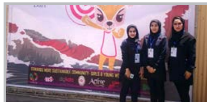
حضور دانشجویان دانشگاه کوثر در چهارمین المپیاد ورزش های همگانی دانشجویان دختر دانشگاه های سراسر کشور