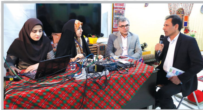
حضور نمایندگان مجلس شورای اسلامی در نمایشگاه