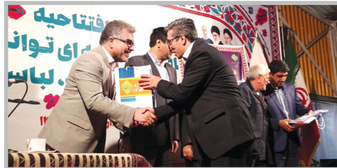
برگزاری شب شعر منطقه‌ای در حاشیه نمایشگاه