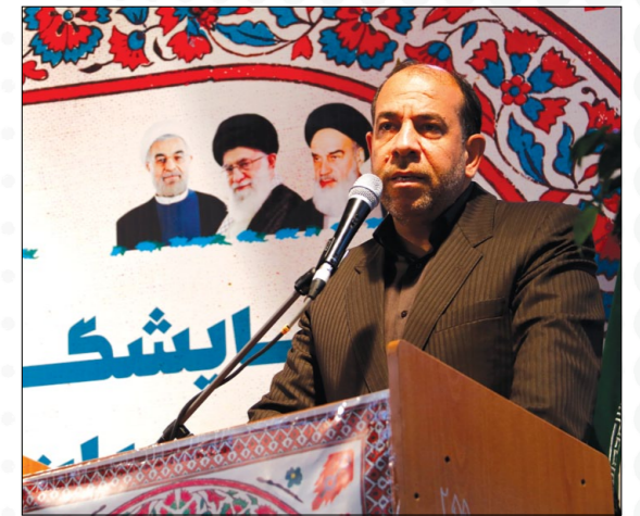
استاندار خراسان شمالی گفت: مد و لباس یک دغدغه فرهنگی است هنرمندان، کارآفرینان طراحان باید در این زمینه بیشتر بپردازند.