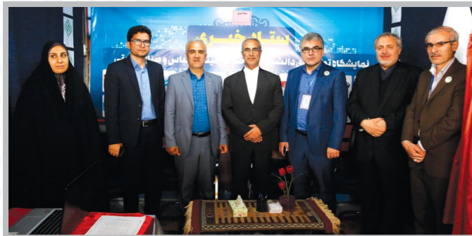
حضور مسئولان استانی و کشوری در ستاد خبری نمایشگاه