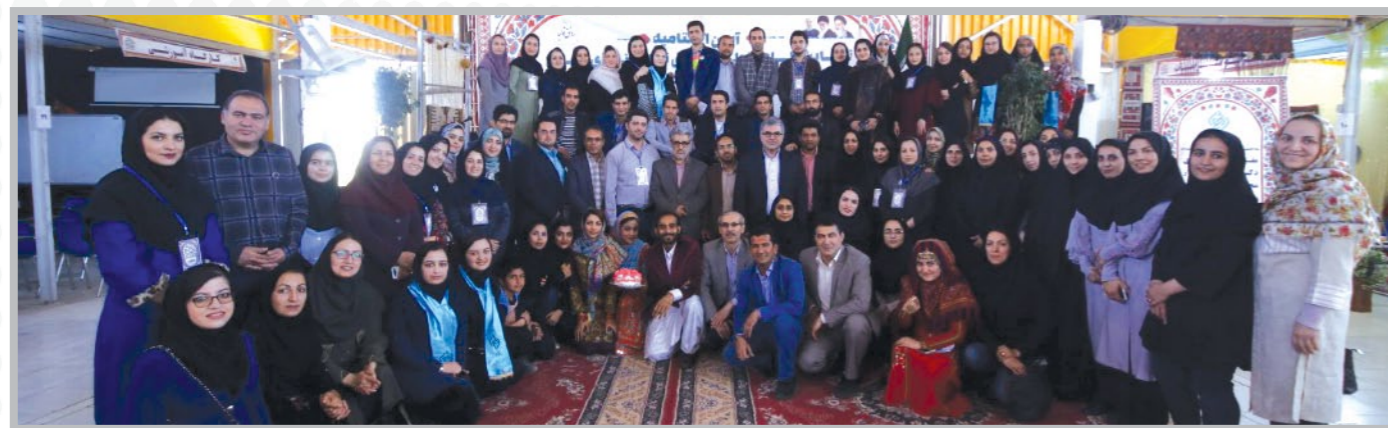
عکس یادگاری عوامل اجرایی نمایشگاه